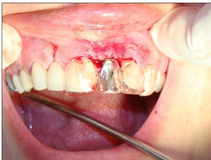
Figura 1 - Posição do implante em relação ao guia cirúrgico