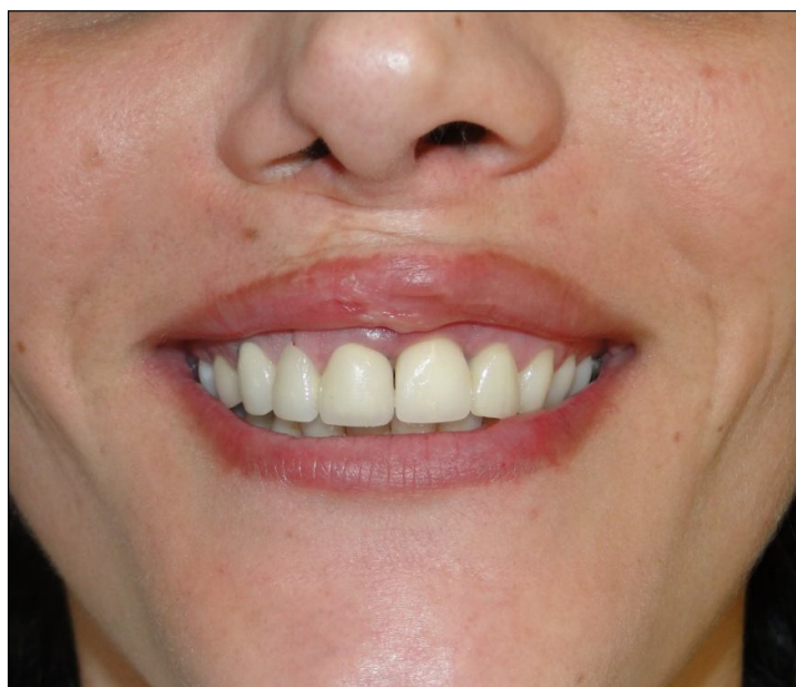
Figura 4 - Vista frontal do elemento protético sobre implante na região do 21