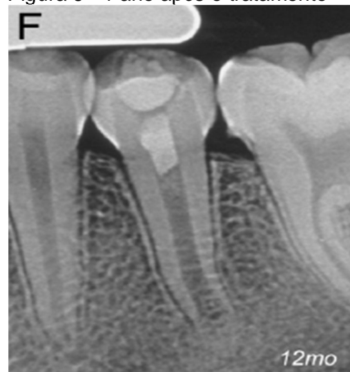
Figura 6 - 1 ano após o tratamento

Legenda: Diminuição da lesão pericapical.