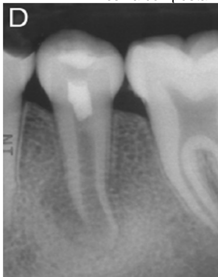
Figura 4 - Final da terceira sessão, após a restauração com resina composta

A paciente retornou após 7 dias para finalização do tratamento. Foi observada ausência total da sintomatologia, portanto o IRM foi retirado e foi realizada restauração definitiva desse dente com resina composta (Figura 4).