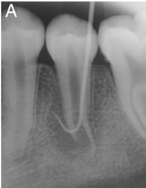
Figura 1 - Diagnóstico radiográfico com cone de guta percha inserida na fístula.

Patrícia Becerra e colaboradores, publicaram um artigo em 2014 chamado Histologic Study of a Human Immature Permanent Premolar with Chronic Apical Abscess after Revascularization/Revitalization , o qual registra radiograficamente as etapas da revascularização e a preservação do caso. Tal caso consiste em uma paciente jovem, de 11 anos, com edema localizado na região de pré-molares esquerdos inferiores, com presença de fístula. Foram realizados testes de percussão e sensibilidade, e obtendo como diagnóstico necrose pulpar e abscesso crônico no segundo pré-molar em questão (Figura 1).