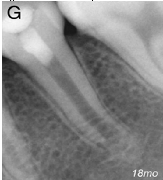
Figura 7 - 18 meses após o tratamento