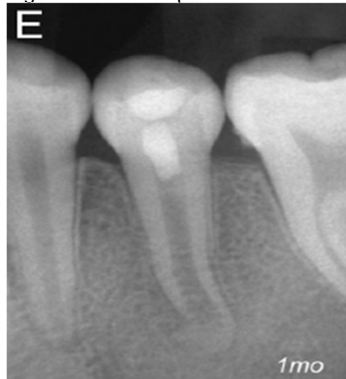
Figura 5 - 1 mês após o tratamento

Foi realizada a preservação radiográfica desse caso com 1 mês (Figura 5), 12 meses (Figura 6), 18 meses (Figura 7) e 24 meses (Figura 8) após o tratamento. Onde constatou-se o fechamento apical quase que completo, e pequeno espessamento das paredes do canal radicular.