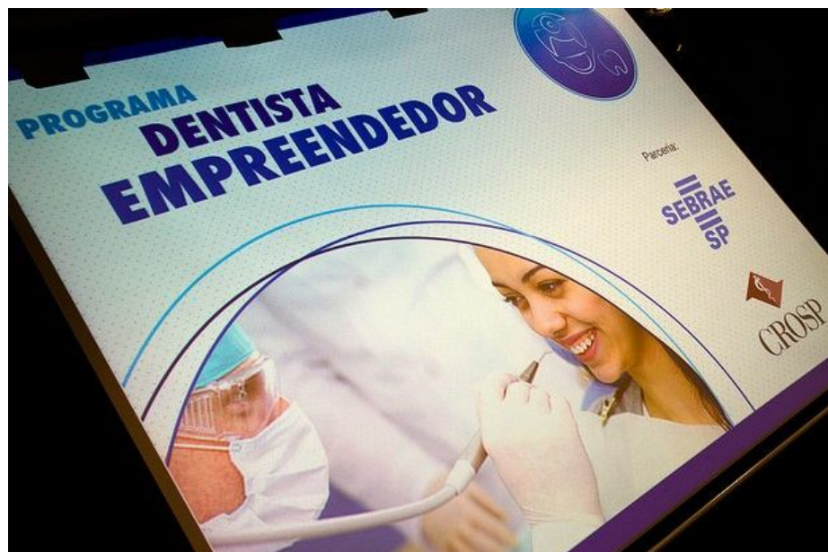
Figura 5. É necessário que o cirurgião dentista desenvolva seu lado empreendedor e para tanto existem cursos específicos que podem ajudá-lo nesse sentido. ( http://www.visaonoticias.com/Noticias/Noticia/8618/dentista-empendedor-em-marilia ).