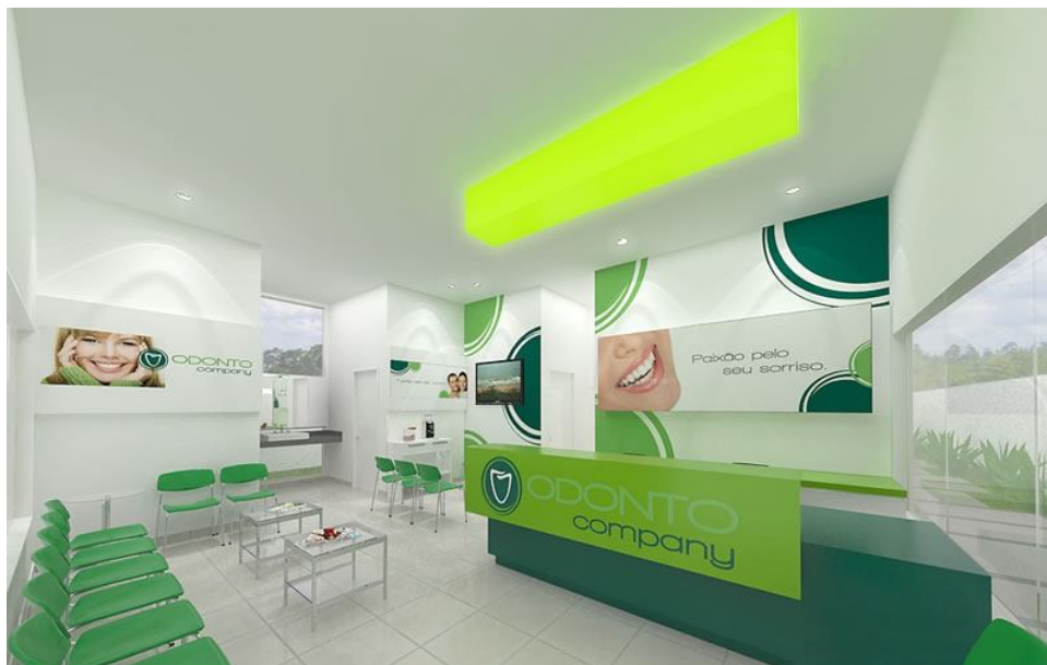
Figura 7. Investir nas instalações do consultório implementando uma logomarca forte e marcante valoriza o empreendimento e ajuda a angariar clientes. ( http://www.revistazelo.com.br/news/2012/05/18/goiania-recebe-franquia-da-rede-odontocompany ).