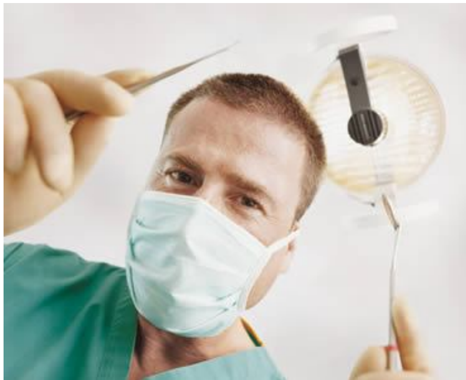
Figura 1. Cultivar positividade e ter atitude confiante com o paciente torna o profissional diferenciado. . ( http://blogkamilagodoy.com.br/25-de-outubro-dia-do-dentista-brasileiro/br ).