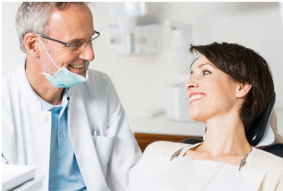
Figura 6. A boa relação entre profissional e cliente gera fidelidade e confiança no atendimento. .(www.kavo.com.br).