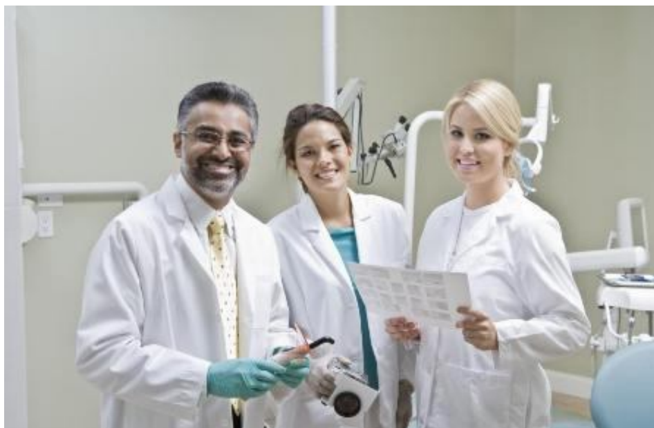
Figura 4. O cirurgião dentista deve sempre exercer a função de liderança evitando conflitos e permitindo um bom relacionamento no âmbito de trabalho.