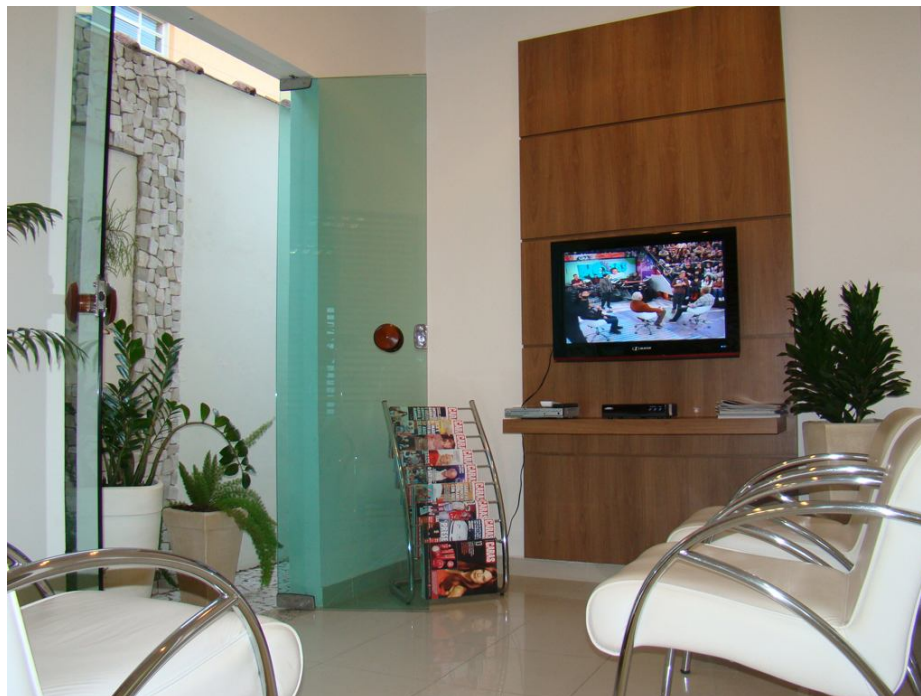
Figura 3: Conhecer o público alvo é requisito importante, pois assim é possível entender suas reais necessidades e expectativas inclusive no quesito decoração. ( www.clinicararo.com.br )