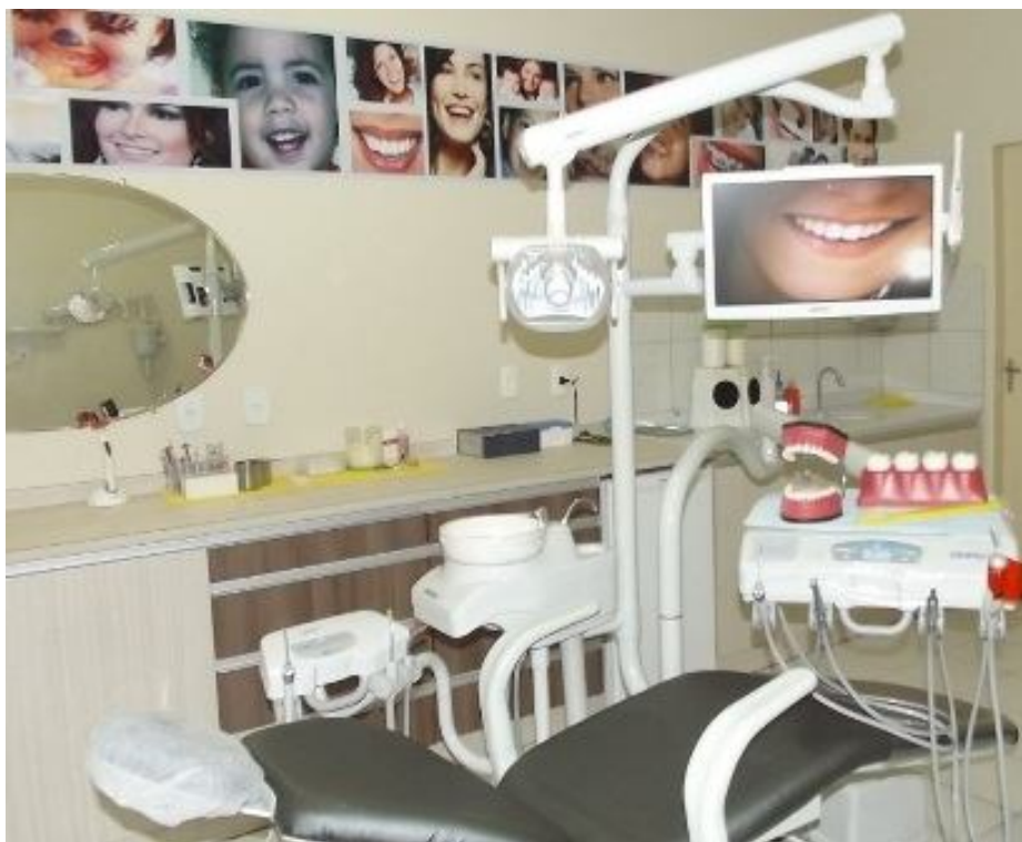
Figura 2. A inserção de novos materiais e equipamentos demonstra um dentista conectado com a profissão. . ( http://corelloimoveis.com.br/vila-madalena-offices2/ovm4/ ).