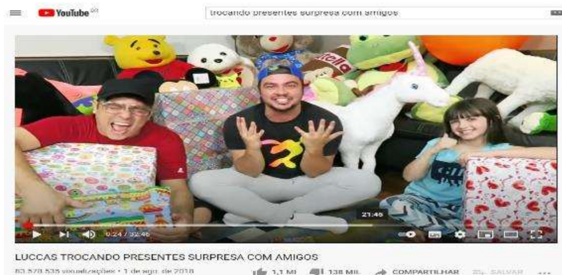
Figura 10- Tela inicial do vídeo Trocando presentes surpresa com amigos

Vídeo 2- Trocando presentes surpresa com amigos – 84.092.151 visualizações, postado em: 01 de Agosto de 2018 (Figura 10)