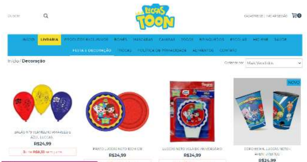
Figura 31- produtos da Loja