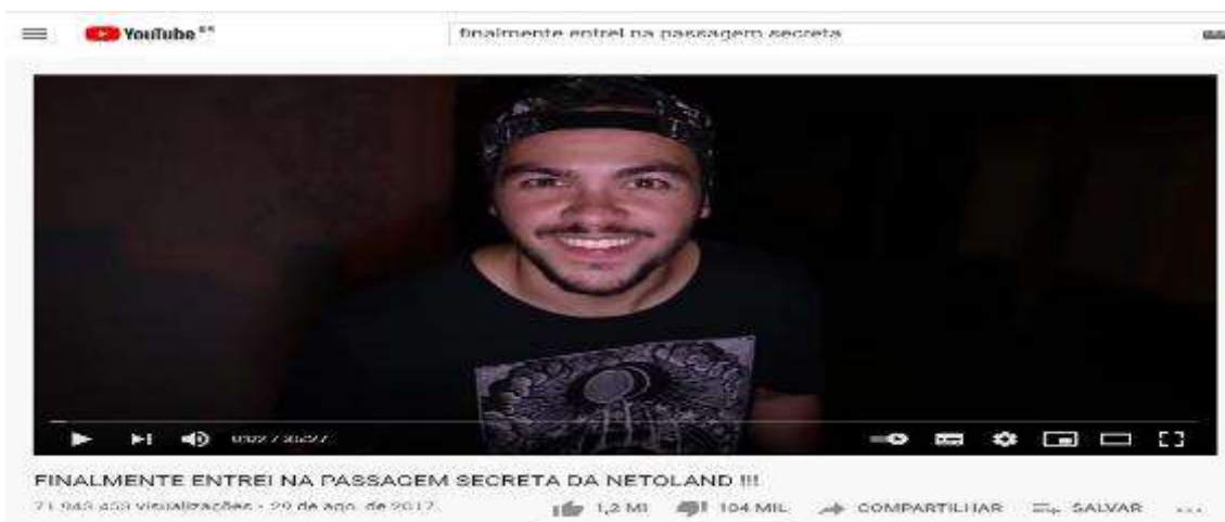
Figura 12- Tela inicial do vídeo Finalmente entrei na passagem secreta da Netoland

Vídeo 4- Finalmente entrei na passagem secreta da Netoland!!! – 72.274.669 visualizações, postado em: 29 de Agosto de 2017 (Figura 12)