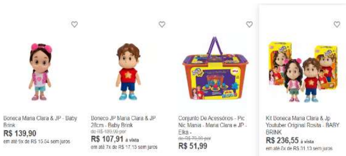
Figura 35- produtos do canal