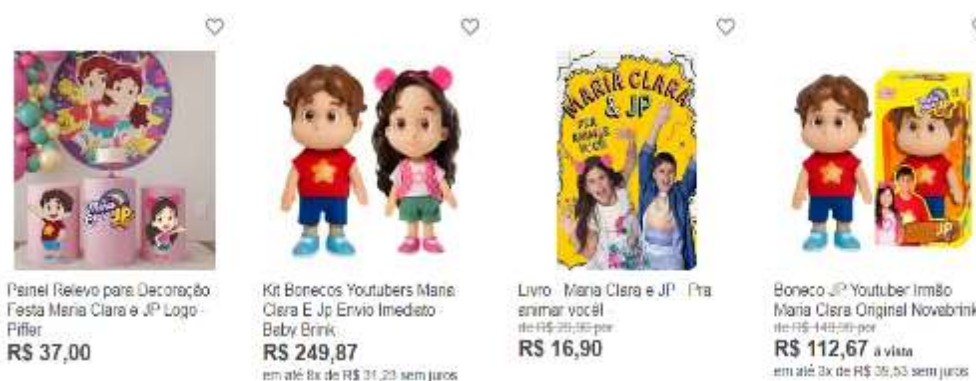
Figura 33- produtos do canal