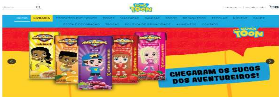
Figura 27- produto da Loja