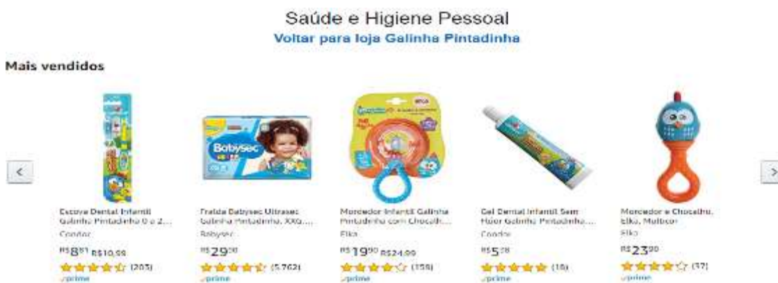
Figura 23- produtos da Loja