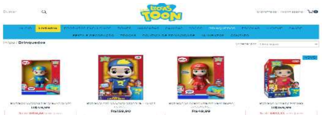
Figura 28- produtos da Loja