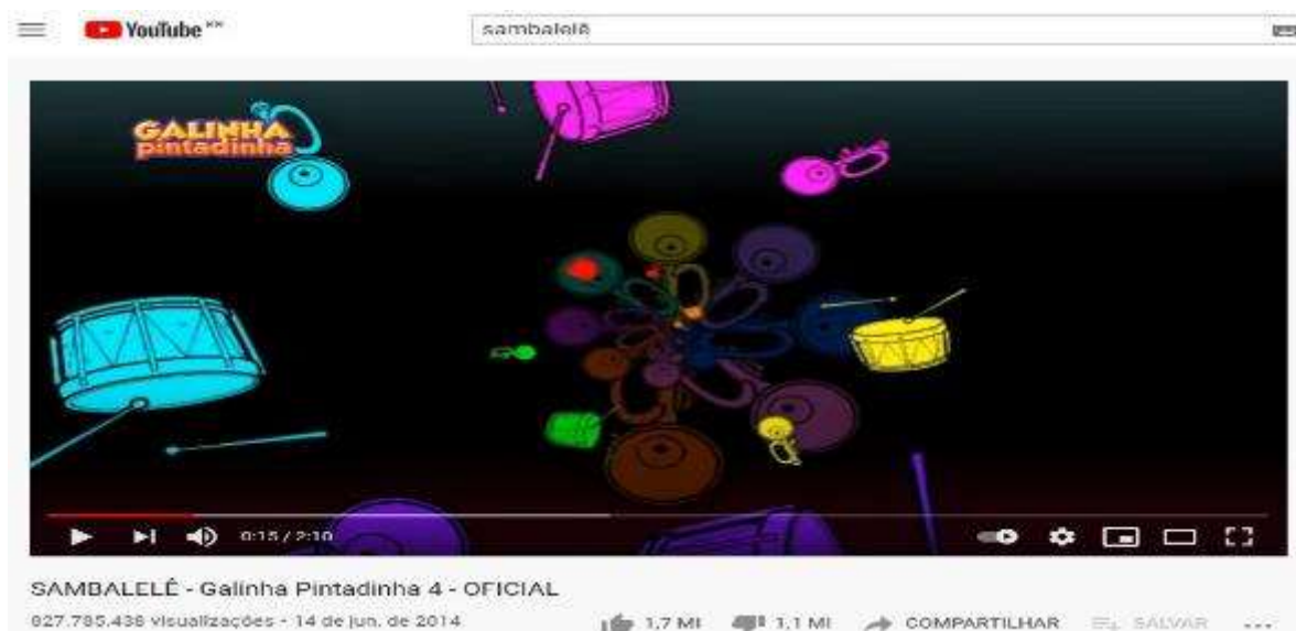
Figura 7- Tela inicial do vídeo Sambalêlê

Vídeo 4- Sambalelê – 827.785.438 visualizações, postado em: 14 de Junho de 2014 (Figura 7)