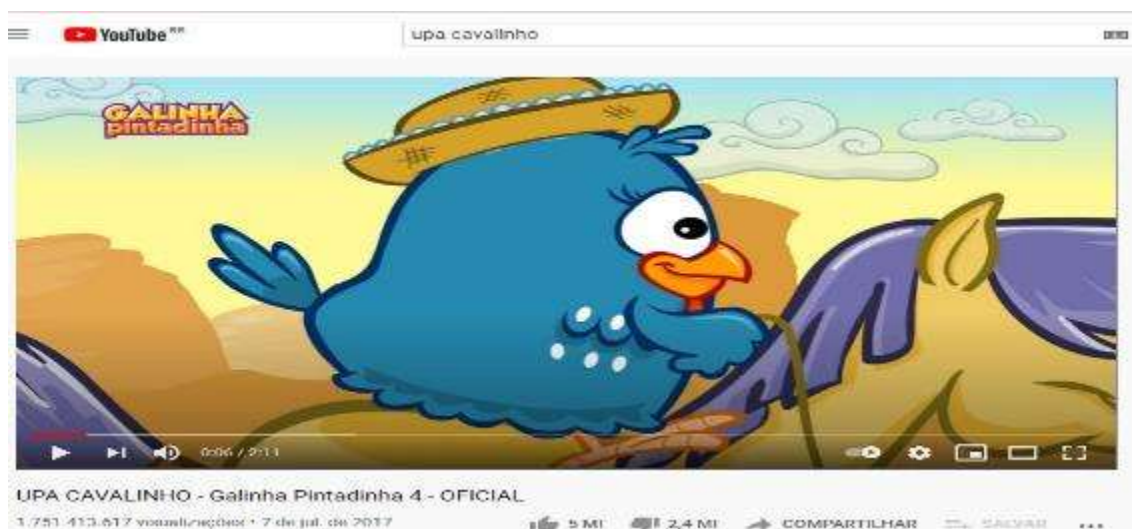
Figura 4 – Tela inicial do vídeo Upa cavalinho

Vídeo 1 – Upa cavalinho – 1.751.413.617 visualizações, postado em: 7 de julho de 2017 (Figura 4).