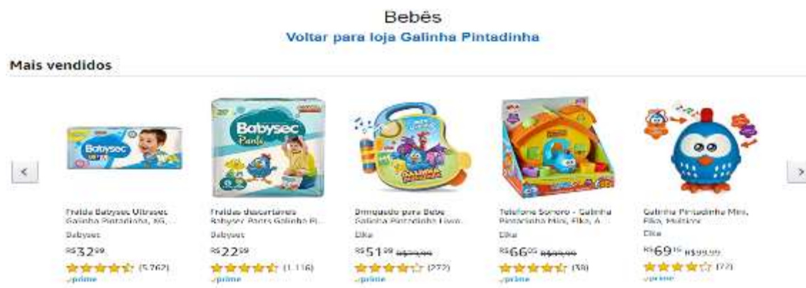
Figura 24- produtos da Loja