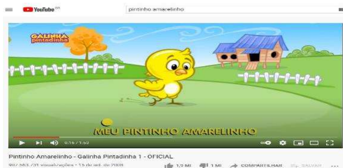
Figura 6- Tela inicial do vídeo Pintinho Amarelinho

Vídeo 3- Pintinho amarelinho – 907. 563. 731 visualizações, postado em: 15 de Setembro de 2018 (Figura 6)