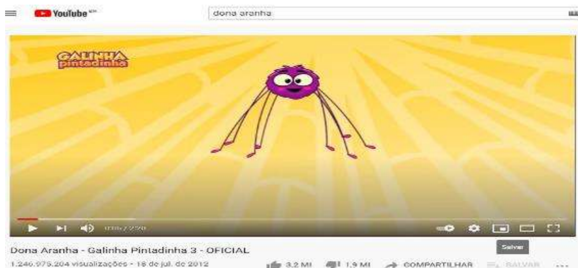
Figura 5- Tela inicial do vídeo Dona Aranha

Vídeo 2- Dona Aranha – 1.246.975.204 visualizações, postado em: 18 de Julho de 2012 (figura 5)