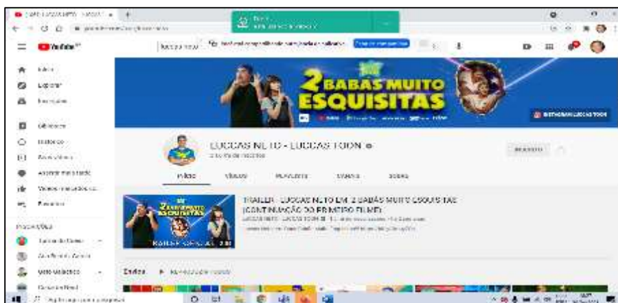
Figura 1- Canal: Luccas Neto – Luccas Toon no Youtube