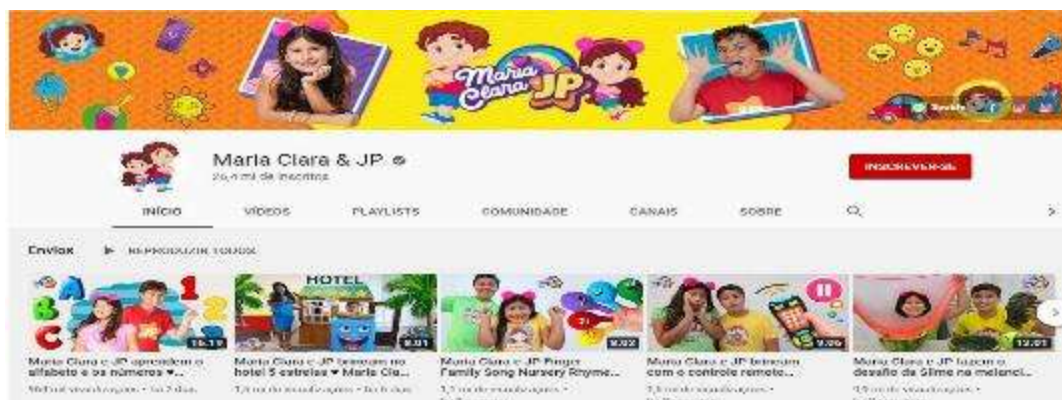
Figura 3- Canal Maria Clara & JP