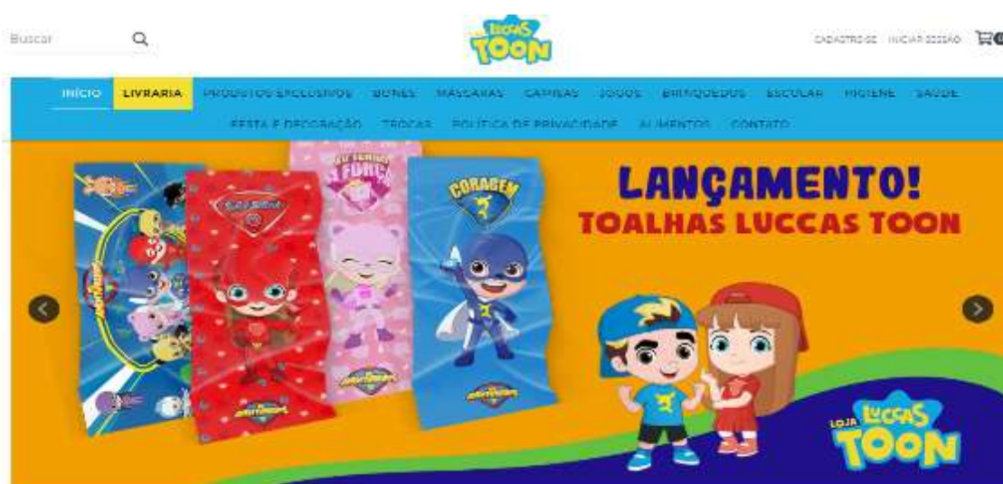
Figura 26- produto da Loja