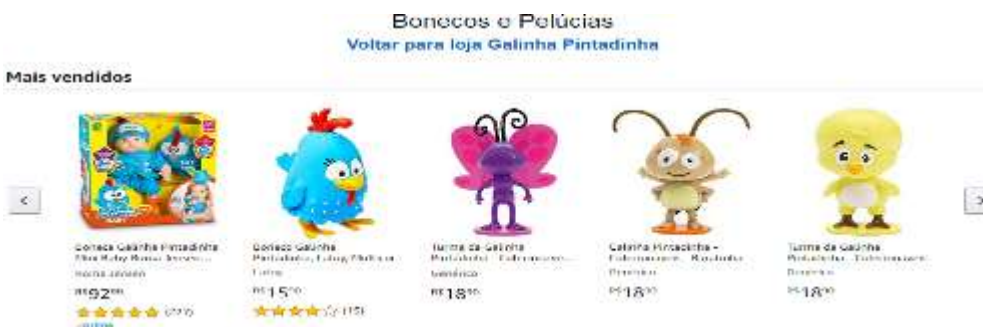
Figura 22- produtos da Loja