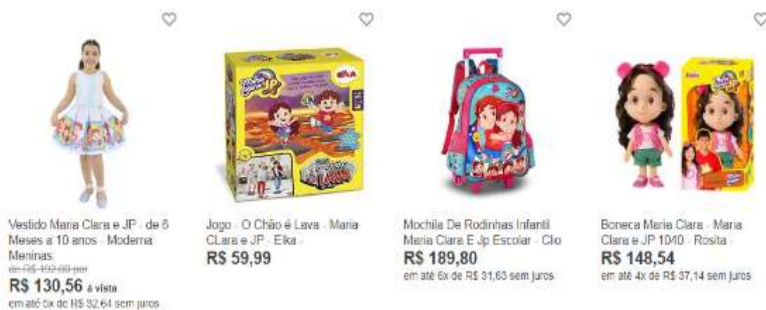
Figura 34- produtos do canal

Fonte: https://www.magazineluiza.com.br/busca/maria+clara+e+jp/