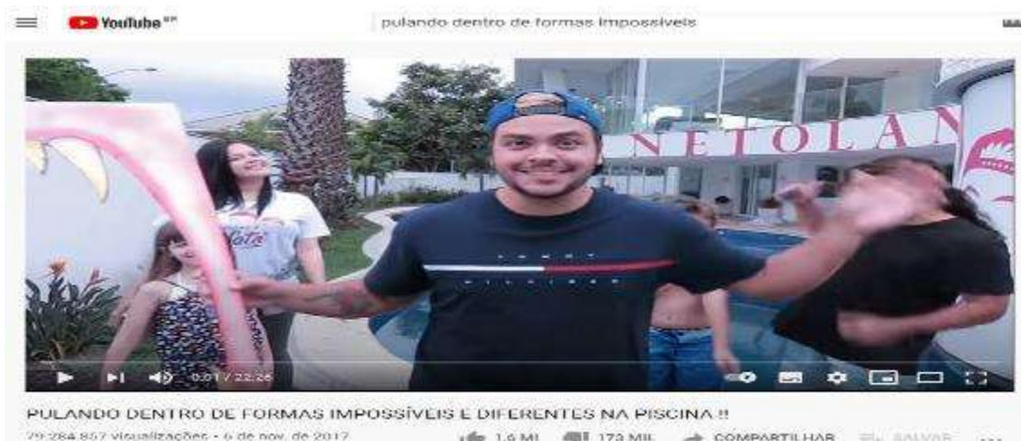
Figura 11- Tela inicial do vídeo Pulando dentro de formas impossíveis e diferentes na piscina

Vídeo 3- Pulando dentro de formas impossíveis e diferentes na piscina!! 81.020.361 visualizações, postado em: 06 de Novembro de 2017 (Figura 11)