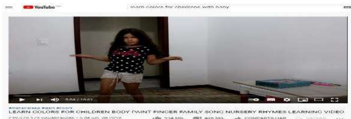
Figura 14- Tela inicial do vídeo Learn colors for children body paint finger family song nursery rhymes learning video

Vídeo 1- Learn colors for children body paint finger family song nursery rhymes learning video – 250.197.432 visualizações, postado em: 05 de Junho de 2018 (Figura 14)