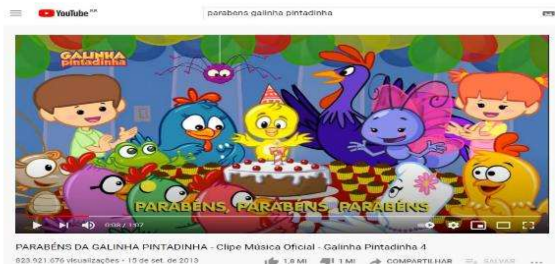
Figura 8- Tela inicial do vídeo Parabéns da Galinha Pintadinha

Vídeo 5- Parabéns da Galinha Pintadinha– 823.921.676 visualizações, postado em: 15 de Setembro de 2013 (Figura 8)