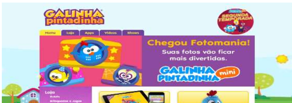
Figura 19- Site da Galinha Pintadinha