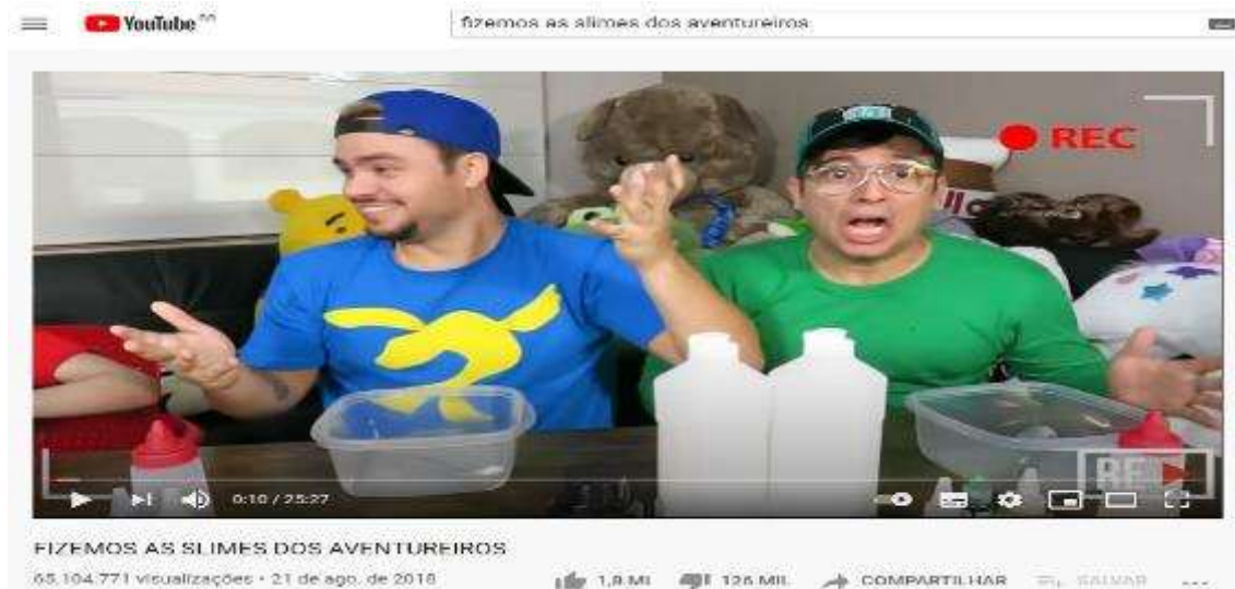
Figura 13- Tela inicial do vídeo Fizemos as slimes dos aventureiros

Vídeo 5- Fizemos as slimes dos aventureiros – 65.191.403 visualizações, postado em: 21 de Agosto de 2018 (Figura 13)