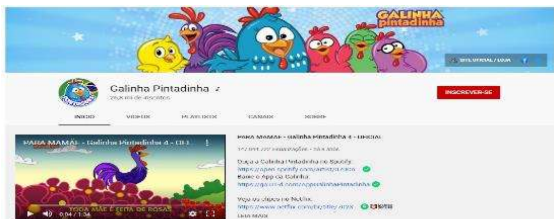
Figura 2 – Canal Galinha Pintadinha