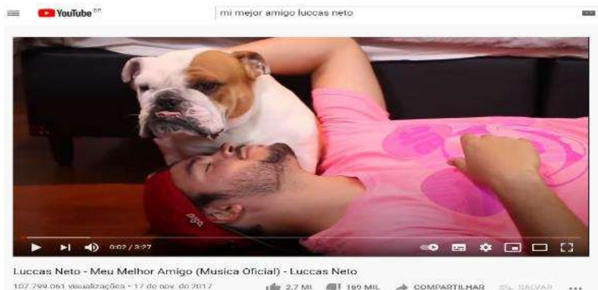
Figura 9- Tela inicial do vídeo Mi mejor amigo

Vídeo 1 - Mi mejor amigo – 108.301.047 visualizações, postado em: 17 de Novembro de 2017 (Figura 9)