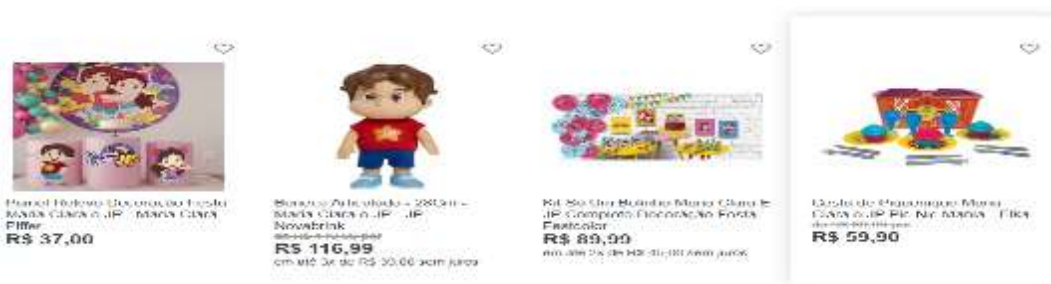
Figura 32- produtos do canal