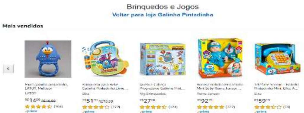
Figura 21- produtos da Loja