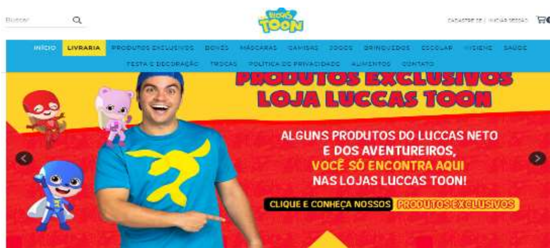
Figura 25- Loja Luccas Toon