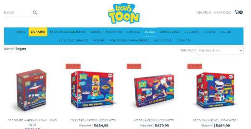
Figura 30- produtos da Loja