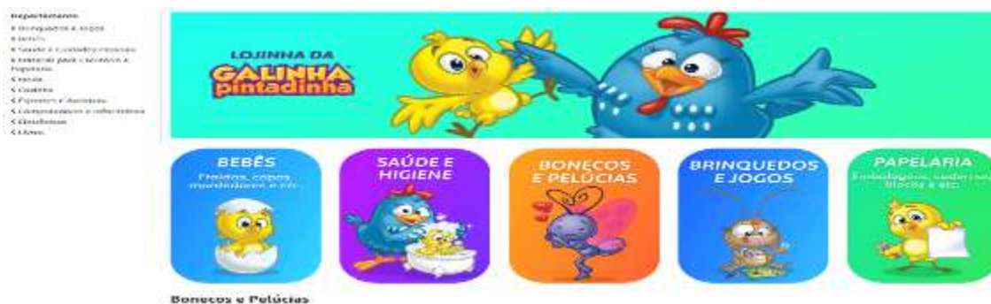
Figura 20- Loja da Galinha Pintadinha