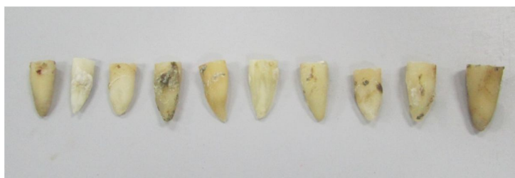
Figura 1: dentes com a coroa seccionada e padronizado em 16 mm.

Foram utilizados para este estudo dentes extraídos humanos unirradiculados, obtidos junto ao Banco de Dentes da Universidade do Sagrado Coração. Os mesmos foram radiografados para verificação da presença de um único canal. Os dentes que apresentaram mais de um canal foram excluídos do estudo. As coroas foram removidas e o comprimento das raízes padronizado em 16 mm (figura 1).