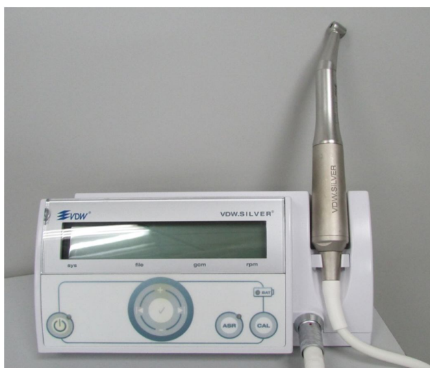
Figura 4: aparelho VDW Reciproc utilizado para acionamento do sistema Reciproc.

O uso foi feito de acordo com o fabricante, ou seja, em 3 avanços, até atingir o comprimento de trabalho.