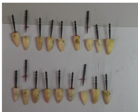
Figura 5: Dentes moldados para confecção núcleo.

Após, foi confeccionado núcleo metálico fundido, e realizado cimentação com fosfato de zinco (figura 5).