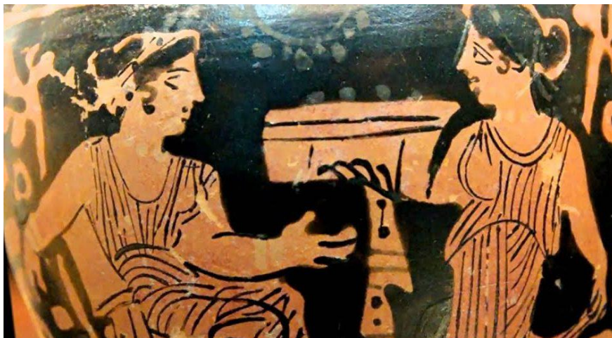
Figura 4 – Pintura mulheres de Atenas.