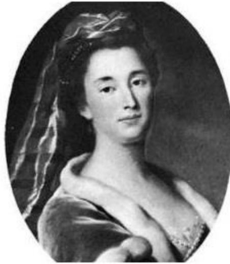
Figura 5 – Therese Du Parc.