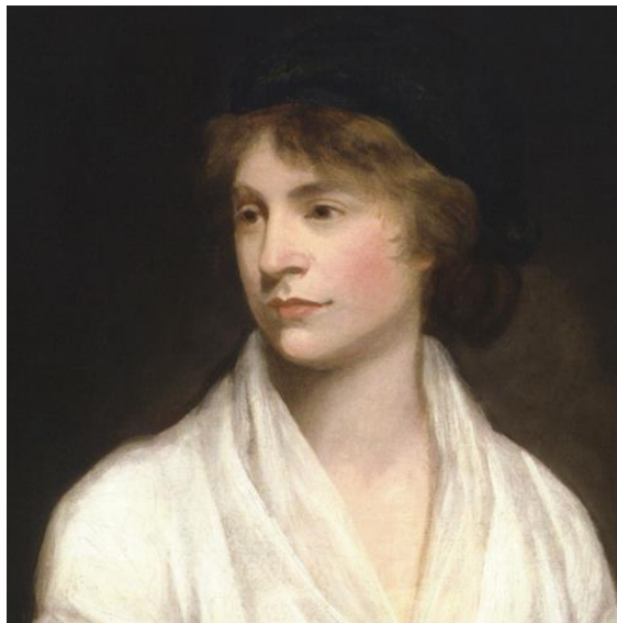
Figura 1 - Mary Wollstonecraft: mãe Do Feminismo e pensadora do iluminismo.

Por debater pelos seus direitos, a revolucionária foi executada em Paris, dia 3 de novembro de 1793. No entanto, sua morte, considerada um marco do feminismo no mundo, fez surgir diversos movimentos feministas posteriores. Entretanto, foi a partir da Revolução Industrial no século XIX, que esse panorama muda de maneira substancial. As mulheres já começam a trabalhar fazendo parte da força econômica do país.