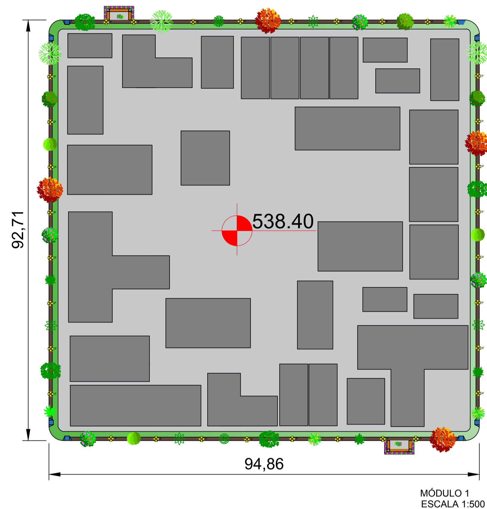
MÓDULO 1 ESCALA 1:500