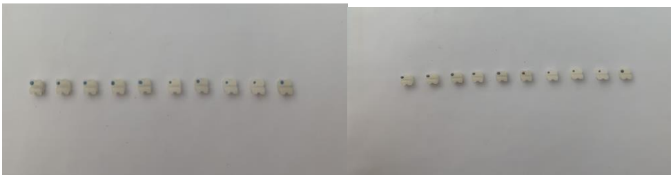
Figura 2b: Fotografia dos braquetes cerâmicos no período T4(14dias) submersos na solução de saliva artificial.

Figura 2a: Fotografia dos braquetes cerâmicos no período T1(24hs) submersos na solução de saliva artificial.