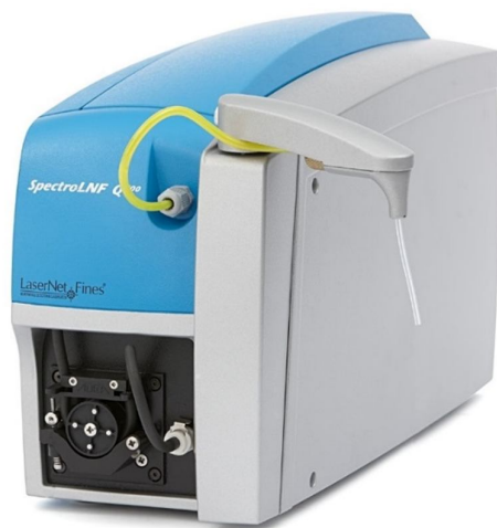
Figura 5: Contador de partículas.