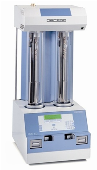
Figura 3: Viscosímetro Automático.