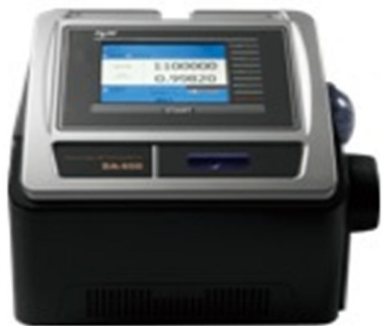
Figura 8: Equipamento Densímetro automático DA 650 Kyoto-Kem.