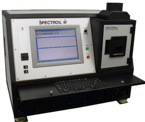
Figura 4: Espectrofotômetro de emissão atômica.