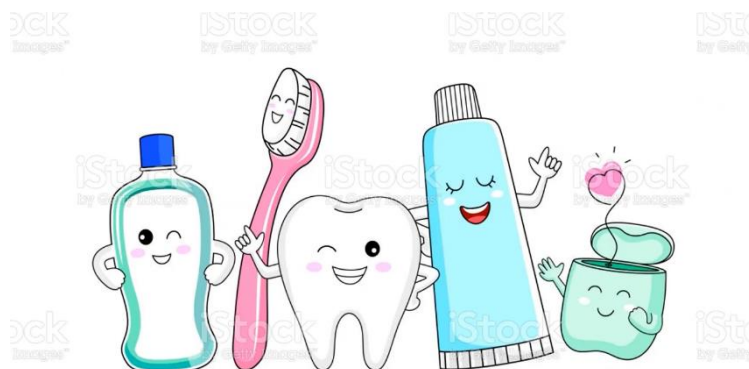
Figura 2- Vídeo 1- Cárie dentária

Apresentado por: Vitória Piasentine Selani