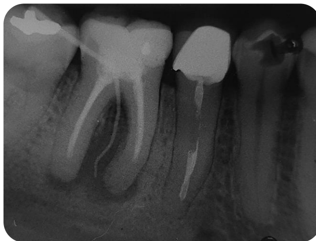
Figura 1 - Imagem radiográfica evidenciando o rastreamento da fístula com origem no dente 46