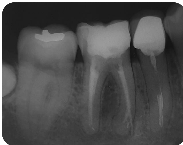
Figura 2 - Imagem radiográfica após 4 meses, evidenciando a neoformação óssea no dente 46